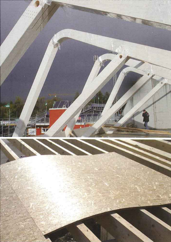
Vor Ort wurden Holzlamellen quer auf den Brett-schichtholz-Hauptträgern verlegt.